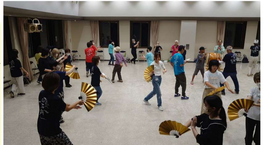
中央公民館での笠岡支部の練習会

※7月15日ですが、仕事の都合等でツアーの時間に間に合わない、最終の定期船で行って帰りの船便があればという方は、サンダル添乗員にご相談ください。(090-5374-1333 守屋) ※なお、カメラ愛好者の方で衣装をつけた踊りを撮りたいとおっしゃる方は7月15日のツアーをご利用いただき、散策で風景写真も含めて楽しんで下さい。盆の時期は浴衣での回向踊となり衣装を着けて、浜で踊るのはこの日しかありません。16日は灯籠流しも行われます。